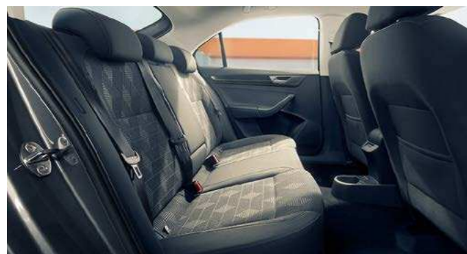
Подогрев задних сидений

Объем багажного отделения до 530 литров с возможностью трансформации салона и увеличения грузового пространства до 1460 литров